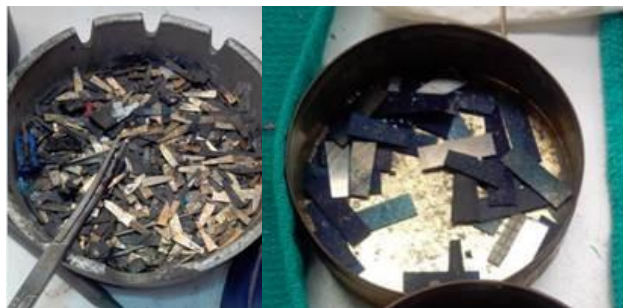
Une température élevée doit chauffer le porte-aiguille