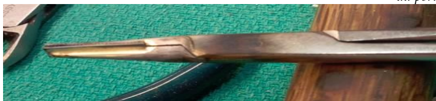
Les mors usés doivent être enlevés et les nouveaux doivent être incérés