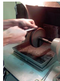
Les mors incérés doivent correspondre aux courbes du porte-aiguille